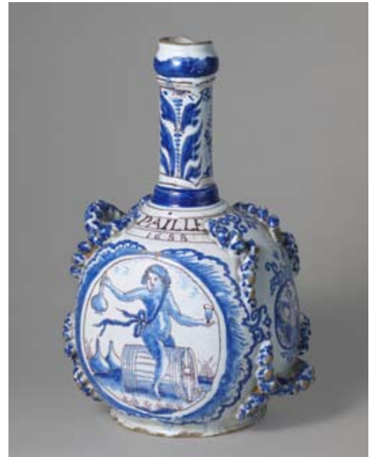
6 - Bouteille, faïence de Nevers, XVIII e siècle, musée national de Céramique de Sèvres