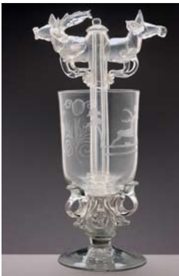
13 - Verre-surprise au cerf et à la biche, verre, XVII e siècle, Allemagne, musée languedocien de Montpellier