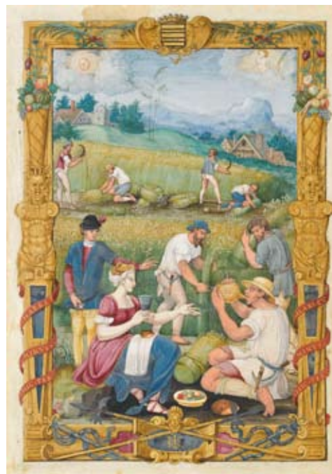
4 - Le mois d'août , Livre d'heures de Claude Gouffier, France, vers 1545, parchemin, enluminure, musée national de la Renaissance d'Écouen.