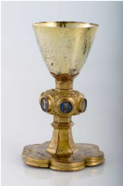
5 - Calice, anonyme italien, Lucques (?), seconde moitié du XIV e siècle, argent doré, cuivre doré, émail translucide, musée des Beaux-Arts de Dijon.