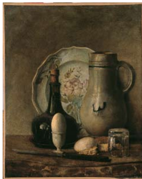
2 - Nature morte , anonyme français, XIX e siècle, huile sur toile, musée des Beaux-Arts de Bordeaux.