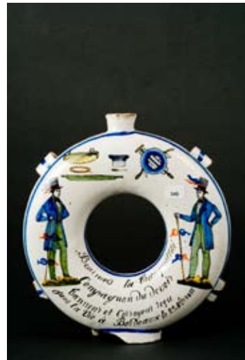
12 - Gourde annulaire de Compagnon du Devoir, Nantes, 1855, musée d'Aquitaine de Bordeaux.