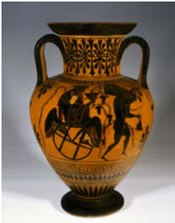
11 - Amphore, peintre de Priam, 520 av. J.-C., musée Antoine Vivenel de Compiègne