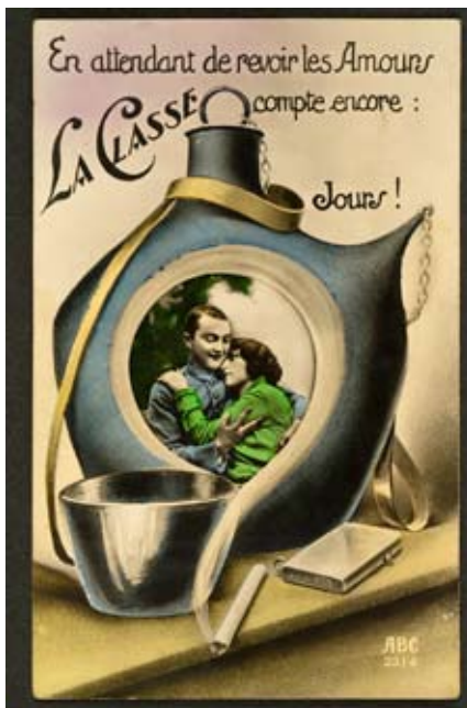
7 - « En attendant de revoir les amours », carte postale de 1914-1918