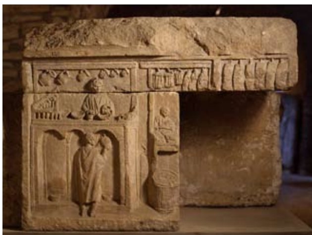
3 - Monument au marchand de vin , Til-Châtel, II e / III e siècle, calcaire, musée archéologique de Dijon.