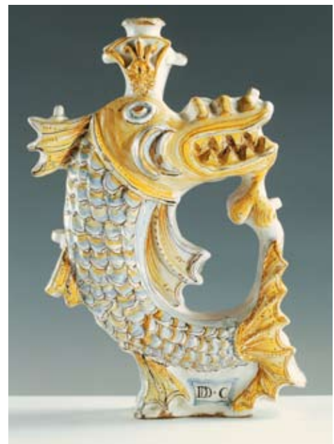
8 - Fiasque, Castelli d'Abruzzo, 1600, majolique, museo del Vino de Torgiano, fondazione Lungarotti