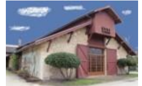
Ecomusée de la vigne et du vin

Dégustation Littéraire® de CEPDIVIN Centre d'Etudes Pluridisciplinaires Des Imaginaires du VIN Conférences - Lectures - Dégustations