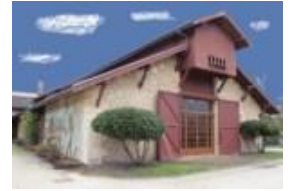
Ecomusée de la vigne et du vin