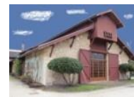
Ecomusée de la vigne et du vin