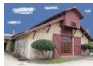
Ecomusée de la vigne et du vin

Débat, lectures et dégustation de vins autour du livre La légende du demi-siècle d'André Laude, aux éditions Levée d'encre, et du roman Autant en emporte le vin , un polar en eaux troubles dans les "claires" de l'île d'Oléron.