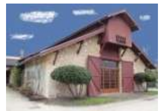
Ecomusée de la vigne et du vin