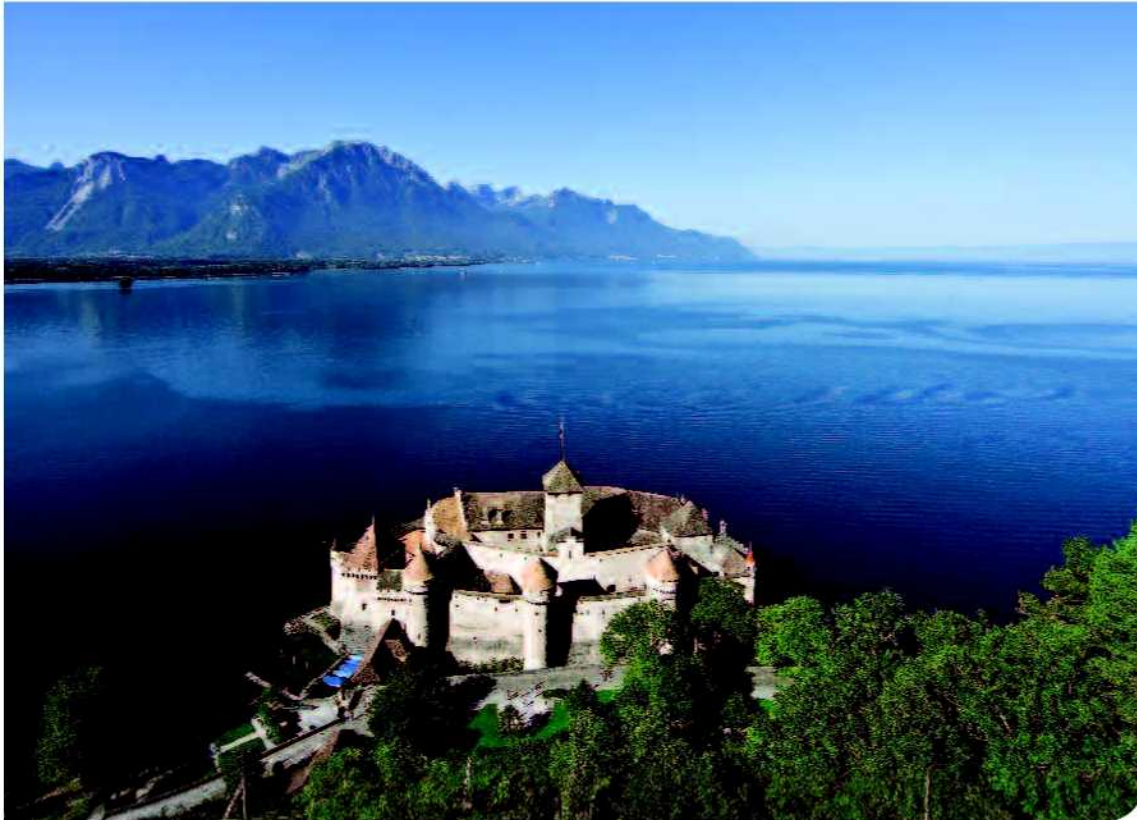
▲ Le château de Chillon compte parmi les stars du patrimoine vaudois.

de savoir-faire que de soutien financier. À l'échelle internationale, l'Unesco réalise un travail énorme par sa liste de sites protégés. En Europe, les Journées européennes du patrimoine, lancées en 1991 par le Conseil de l'Europe, se tiennent chaque année entre fin août et début novembre. Elles proposent, dans plus de 40 pays dont la Suisse, de visiter des édifices ouverts exceptionnellement au public. Lors de l'édition 2008, 11 millions de visiteurs ont ainsi pu découvrir 15'000 sites. Des visites qui se poursuivent toute l'année en Suisse grâce à l'Association Suisse des Guides-Interprètes du Patrimoine qui propose, par canton, des balades ou visites guidées à travers les trésors du patrimoine. Quant à la préservation au niveau régional, on notera, entre autres, le travail d'associations comme RéseauPatrimoineS, association pour le patrimoine naturel et culturel du canton de Vaud, qui s'est donné pour mission d'agir sur les plans éthique, civique, politique, scientifique et économique pour la conservation et la promotion du patrimoine vaudois. Il y a aussi le travail entrepris par le Département des infrastructures du canton de Vaud, qui procède à un recensement architectural afin de déterminer les constructions dignes d'être conservées et protégées. Sensibles