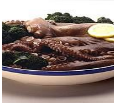
La gastronomie des Açores

La gastronomie des Açores offre quelques espèces de poissons et de fruits de mer uniques au Portugal. Dans les neuf îles des Açores, les fruits de mer sont ce qu'il y a de plus exquis, avec en tête la cigale de mer, les balanes et les patelles que l'on retrouve dans toutes les îles. Tout comme les poissons qui sont servis en grillades ou en bouillabaisse et les soupes de poisson. Le polvo guisado (poulpe en daube) est l'une des spécialités les plus répandues.