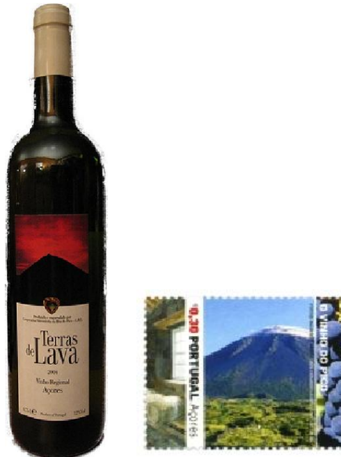
Le Pico illustre tout, de la bouteille au timbre-poste.