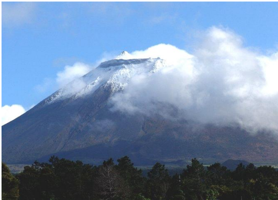
La masse imposante au sommet enneigé du volcan du Pico.

Situé à 2'351 mètres au-dessus de la mer, le cratère du Pico couronne la montagne de ses 30 mètres de circonférence – pour une profondeur à peu près équivalente. Le point culminant porte le nom du Pico Pequeno ou Piquinho (petit pic). C'est un cône volcanique, d'où des fumerolles s'échappent encore aujourd'hui. Le volcan écrase toute l'île de sa stature solennelle.