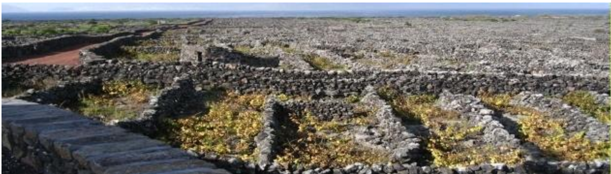
Une bien curieuse façon de créer le vignoble sur l'île volcanique du Pico (en hiver).