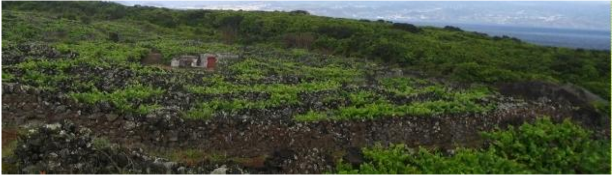
Le vignoble en pleine végétation.

L'écrivain voyageur Raúl Brandão ne s'y est pas trompé. "L'île du Pico est la plus belle et la plus extraordinaire des îles des Açores", écrivait-il à la fin du XIX e siècle, "d'une beauté unique, d'une couleur admirable, elle exerce sur le visiteur un étrange pouvoir d'attraction. "Séduit par le paysage que domine le volcan, "statue" dressée vers le ciel et comme fondue par l'embrasement des entrailles de la terre", il a aussi été conquis par ceux qui peuplaient cette terre. "Les hommes du Pico sont les plus sains que je connaisse. Ce sont des rocs et leur regard ne ment pas." C'est peut-être à ces qualités que les habitants du Pico doivent d'avoir réussi à préserver la beauté de leur île et son incroyable enchevêtrement de vignobles. Car, à n'en pas douter, l'île du Pico est vraiment un endroit exceptionnel. Une simple description géographique suffit à le démontrer.