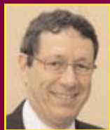
Jacques BASCOU Député-Maire de Narbonne Président de la Communauté d'Agglomération de la Narbonnaise

Forte de toutes ces propositions, nul doute, dès lors, que cette manifestation saura rencontrer l'adhésion des Narbonnais et des Narbonnaises.